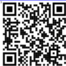
ACCESS CODE CARD